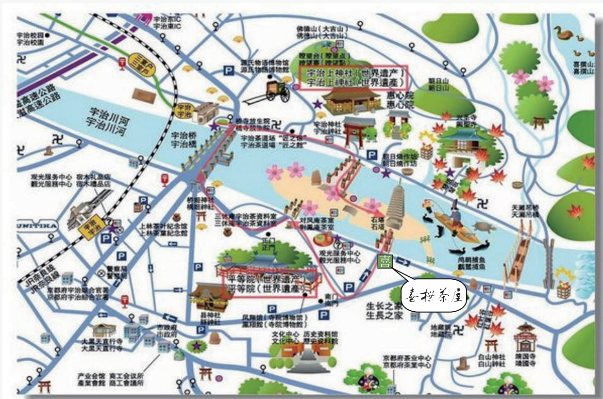
公益社団法人宇治市観光協会作成 宇治イラストマップより

平等院鳳凰堂 徒歩2分 源氏物語ミュージアム 徒歩13分 宇治上神社 徒歩10分 興聖寺 徒歩13分