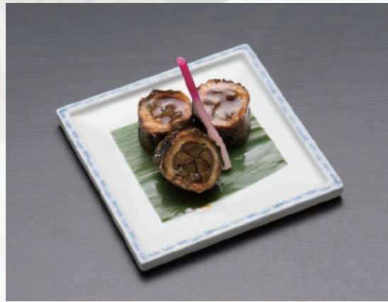
うなぎ八幡巻 五五〇円