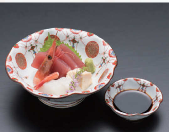
造り盛合せ 七七〇円