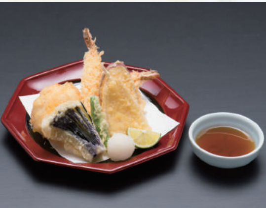
天ぷら盛合せ 八二五円